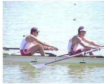
6 - R2