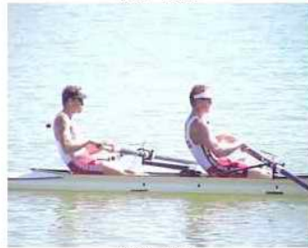
30 - D5