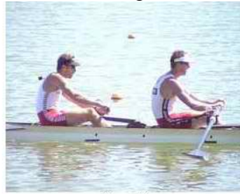
2 - R2