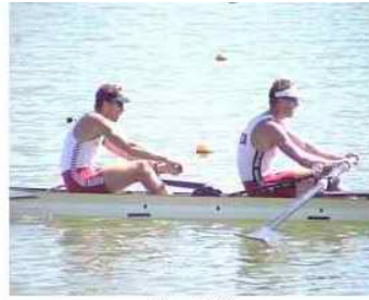
3 - R2