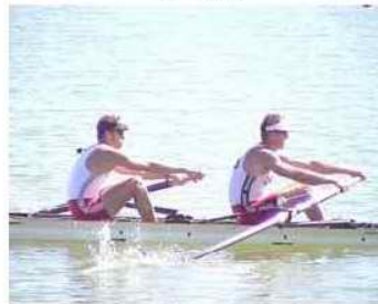
18 - D3