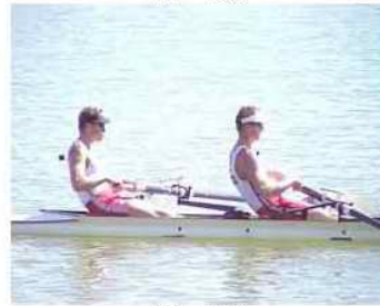
31 - D6