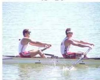
22 - D4