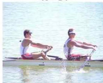
23 - D4