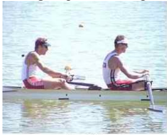
1 - R2

Schlagfrequenz 36.5 spm, Video 25 Bilder pro Sekunde, Bildnummer – Mikro-Phase.