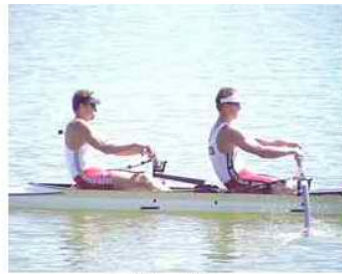
26 - D5