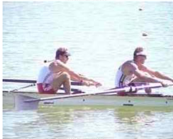
9 - R3