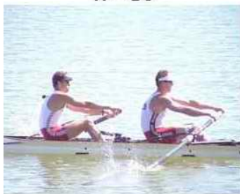
21 - D4