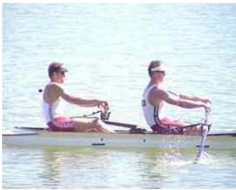
25 - D5