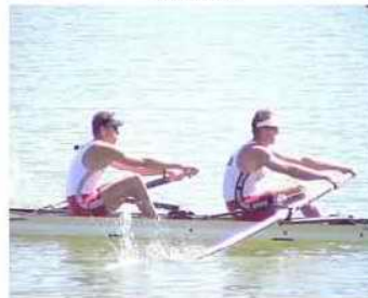
19 - D4