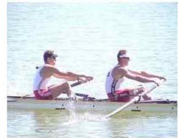
20 - D4