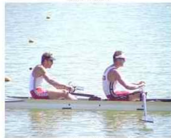
43 - R2