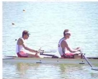
42 - R2