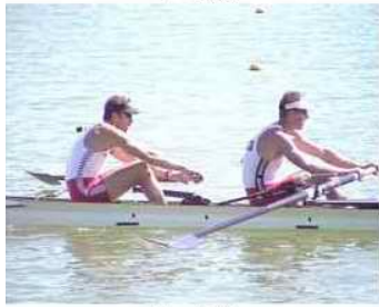
5 - R2