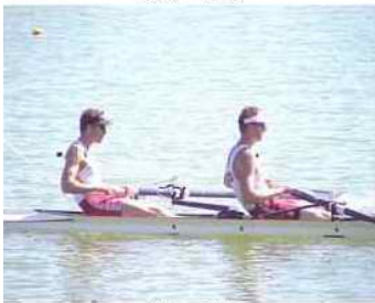
37 - R1