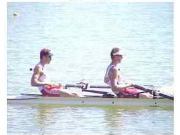
36 - R1