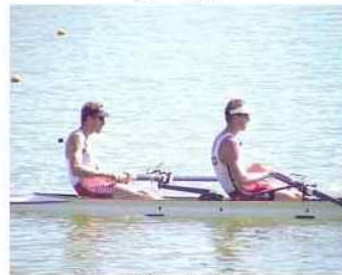
39 - R1