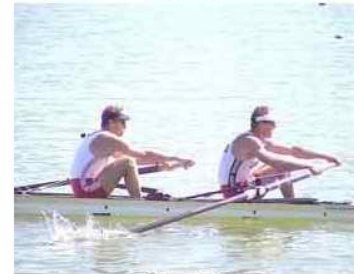
16 - D2