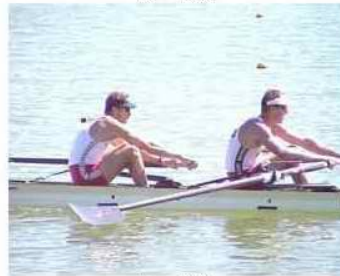
7 - R3