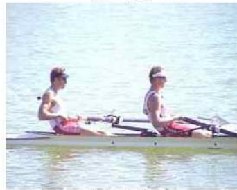
34 - D6