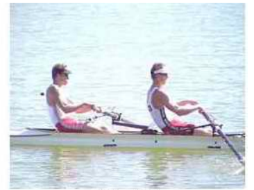
28 - D5