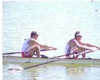
15 - D2