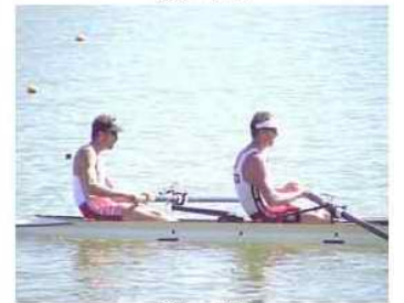
40 - R1