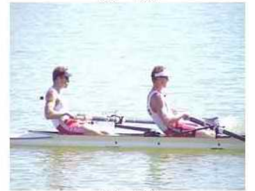
32 - D6