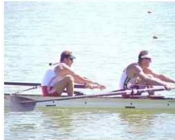
10 - R3