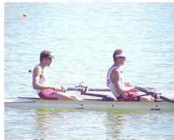
38 - R1