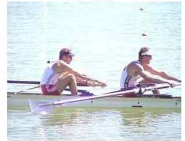
8 - R3