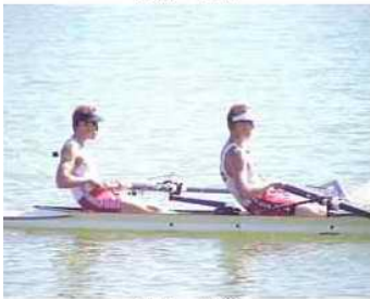
33 - D6