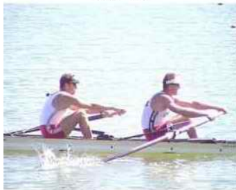
17 - D3