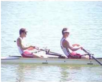
29 - D5