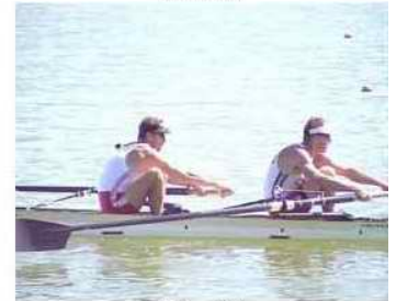
12 - D1