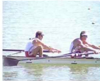
11 - R3