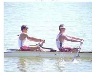
24 - D4