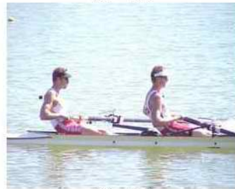
35 - R1