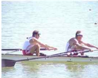
13 - D1