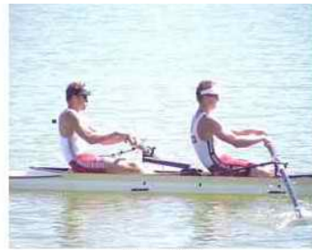
27 - D5