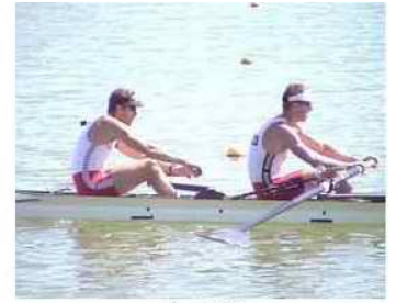
4 - R2