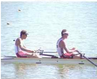
41 - R1