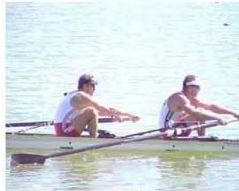
14 - D1